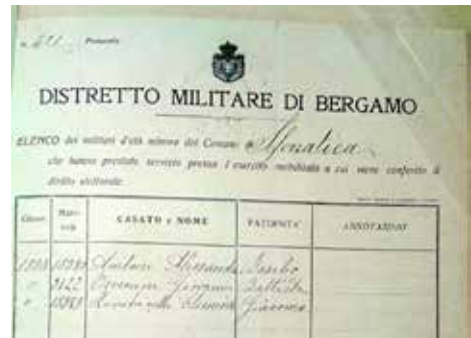
Diritto elettorale conseguito con la partecipazione alla Guerra

Anche se è molto difficile conoscere le loro storie, possiamo dire che essi vissero