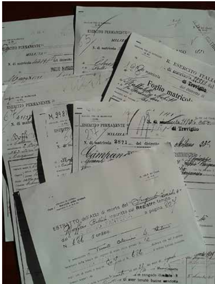
Fogli matricolari