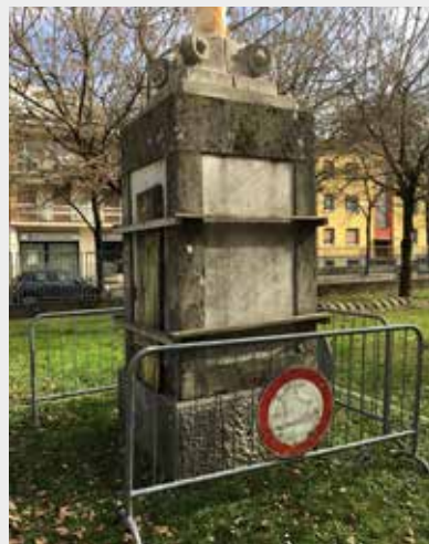
Il monumento come si presenta oggi dal 1999