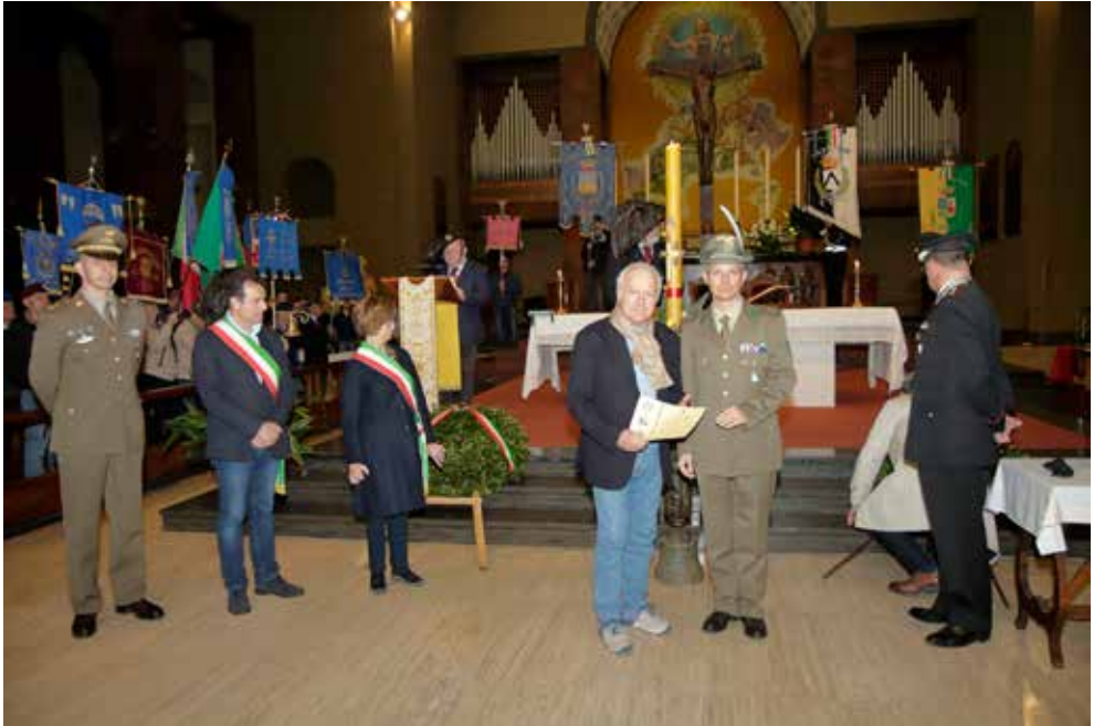
Consegna degli attestati alle famiglie dei caduti dalminesi al Sacriario di Udine (14.04.2018)