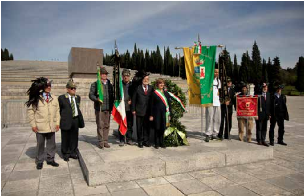
Al Sacriario di Redipuglia (14.04.2018)