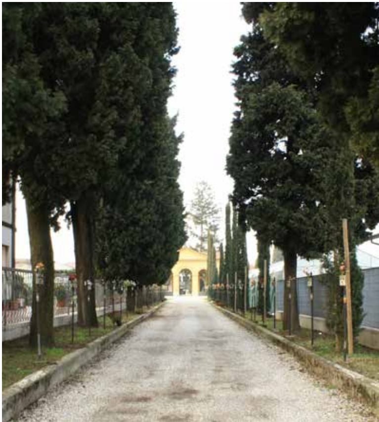
Viale del cimitero napoleonico di Sforzatica con le targhe dei caduti in guerra