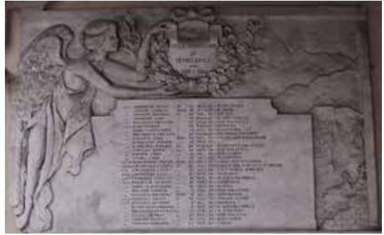
“Ai prodi caduti delle parrocchie di Sforzatica”