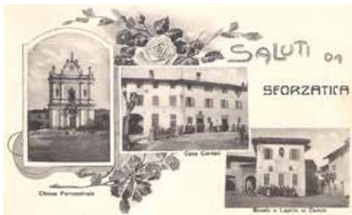
Cartolina di Sforzatica con la foto del Comune su cui era apposta la lapide ai Caduti