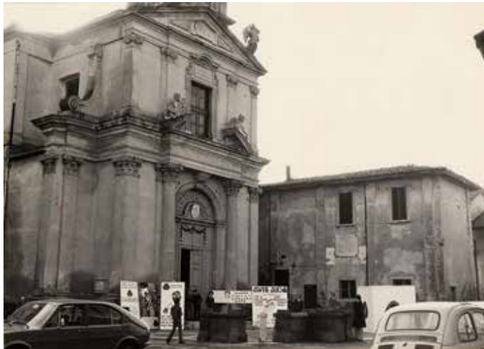
Lapide a ricordo dei caduti, un tempo posta sopra l'ingresso dell'ex Comune di Mariano