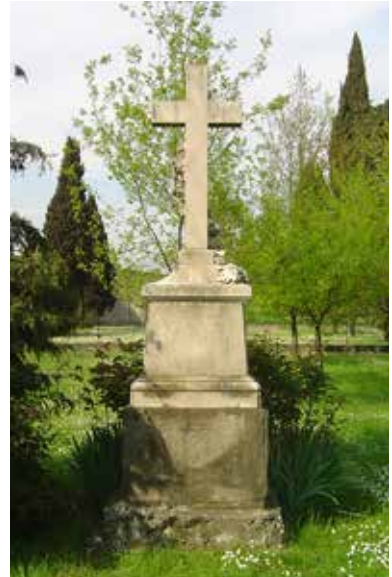
Monumento ai caduti nell'ex cimitero di Sabbio

Il Prefetto si complimentò vivamente per quello che definì un "poema dannunziano" degno del Parlamento. In rappresentanza della direzione dello stabilimento "Dalmine", che aveva donato "i tripodi in ferro lavorato, portanti sulla cima la targa in smalto", che riportava il nome di ogni caduto e il luogo della sua morte, non poten-