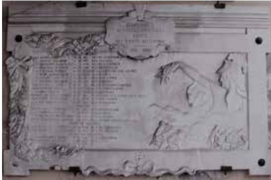
“Sforzatica ai suoi diletti figli caduti sul campo dell'onore”

A Sforzatica il ricordo per i caduti della prima Guerra Mondiale venne onorato in tempi rapidi se si considera che il giorno 10 ottobre del 1920, domenica, si ebbe l'inaugurazione solenne del monumento che li ricordava. Si trattò inoltre di un atto di riconoscenza del tutto particolare poiché il monumento consisteva in due artistiche lapidi, opera dello scultore di Bergamo Giorgio Agosti. La cerimonia ufficiale, come riportò “L'Eco di Bergamo” del 12 ottobre, ebbe inizio sulla piazza del paese dove prestarono servizio il corpo musicale di Albegno e quello di Osio Sotto; alla presenza delle autorità locali, della rappresentanza dei mutilati e degli invalidi di guerra e degli ex combattenti con le loro bandiere, delle famiglie dei caduti e del direttore contabile degli Stabilimenti Dalmine, fu scoperta la lapide dedicata ai 23 caduti appartenenti al comune di Sforzatica, posta sull'edificio della casa comunale, divenuta poi scuola elementare. Dopo la benedizione di rito e brevi parole del generale Felice de Chaurand, presidente onorario della commissione per le onoranze, parlarono l'on. Freda, l'ex combattente sergente sig. Lodetti, il signor Piazza per i mutilati di Bergamo e da ultimo il signor Buttaro, presidente degli ex combattenti dello stabilimento che, con parole vibranti, accennò alla necessità di nuove lotte per un divenire sempre migliore della società.