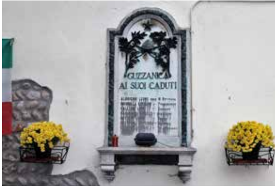
Lapide di Guzzanica