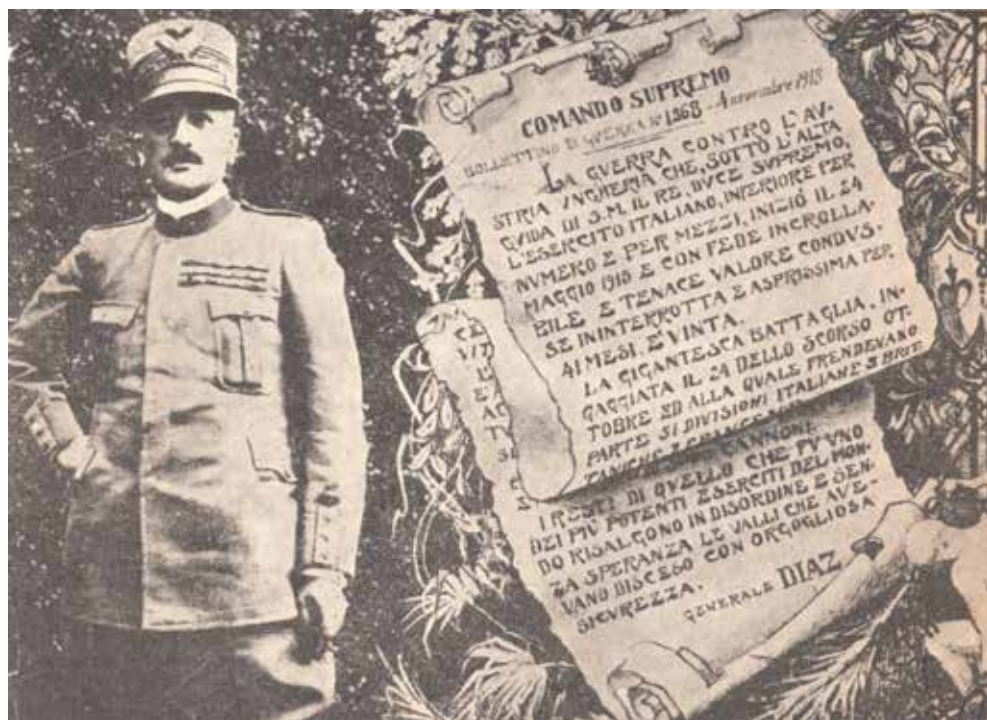
Cartolina con il generale Armando Diaz e il bollettino della Vittoria n. 1268