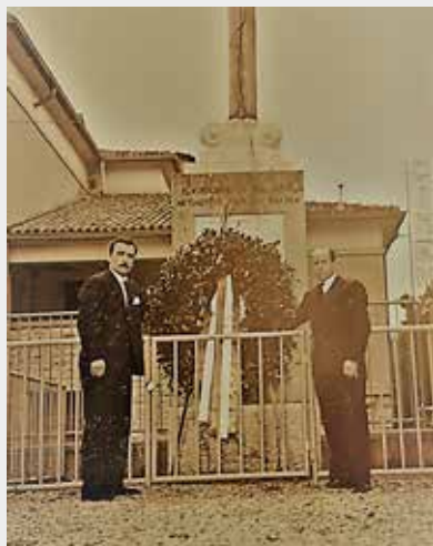
Deposizione di corona di alloro al monumento della scuola da parte dell'AVIS Dalmine (1959-1963)