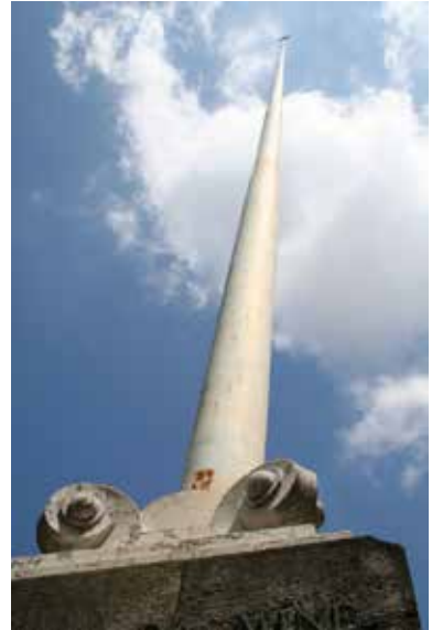
Antenna posta sul monumento ai caduti nel parco della scuola primaria "Carducci"

Sul lato frontale 18 del basamento è riportato per intero il comunicato finale del generale Diaz.