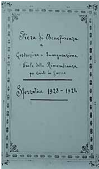
Fascicolo della documentazione della “Fiera di Beneficenza e Costruzione e Inaugurazione Viale delle Rimembranze