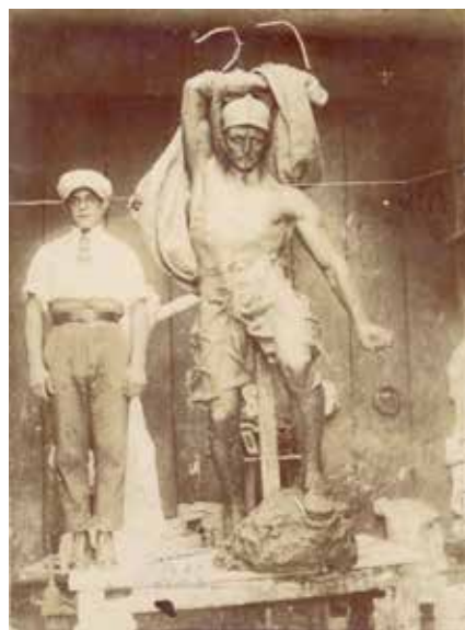
Foto del monumento in fase di realizzazione

Neanche dopo che la statua, possente e ieratica come mostra una foto scattata in fase di