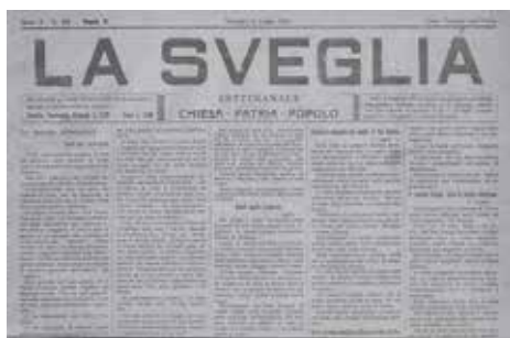
Settimanale di Treviglio