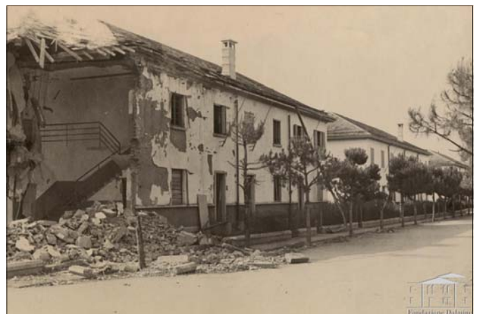
Fondazione Dalmine, St. Da Re, Case danneggiate dal bombardamento