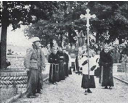
Funerale per i caduti del bombardamento