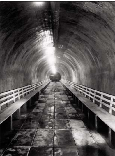
Fondazione Dalmine, St. Da Re, Dalmine. Rifugio antiaereo.

6 Luglio 1944, una data che evoca subito per Dalmine una immane tragedia che ha provocato più di 270 vittime, 800 feriti e traumi esistenziali a tutta una comunità che già aveva vissuto il problema dell'immissione nel suo tessuto sociale di nuova classe di lavoratori arrivati con le loro famiglie, i loro modi di vivere e i loro dialetti, a volte incomprensibili, da altre zone d'Italia ed anche dall'estero.