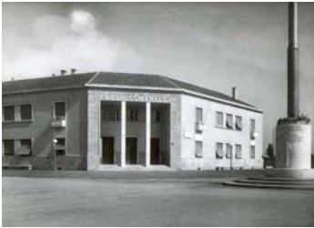
Casa comunale (1938)