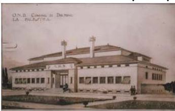
Progetto per la palestra G.I.L.