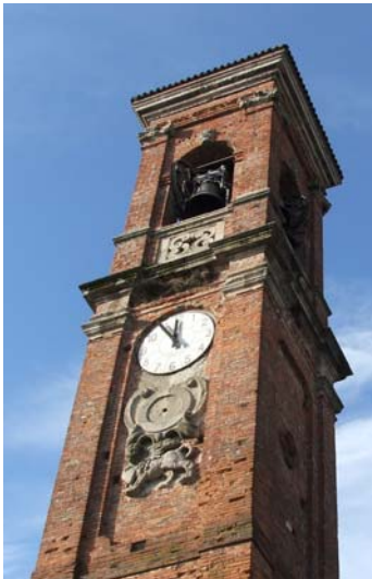
Campanile della chiesa di Sabbio con leone di S. Marco