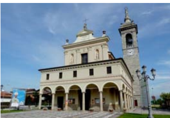
S. Lorenzo in Mariano