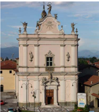
S. Maria d'Oleno